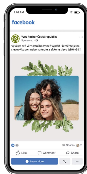
FB Custom Audience

✗ Uživatel nenakoupí a dále pokračuje v retenčním scénáři.